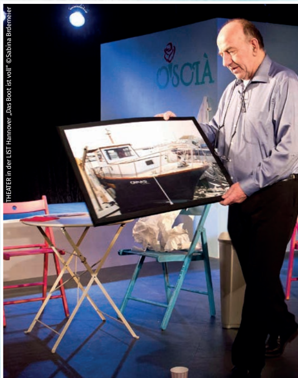
THEATER in der LIST Hannover „Das Boot ist voll“