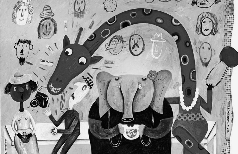
Illustration aus dem Buch Giraffenmama und andere Ungeheuer von Alexandru Salmela