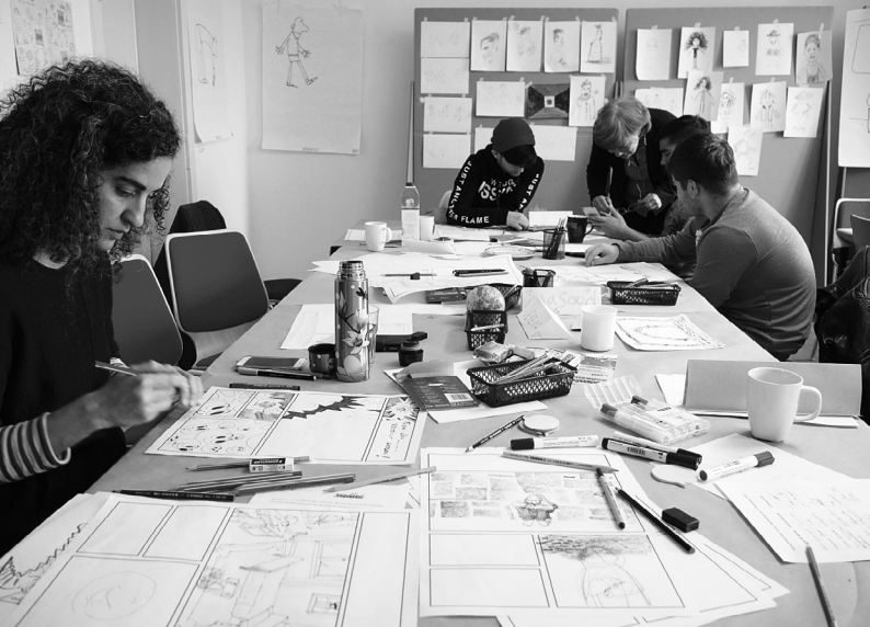
Comic-Workshop „fremdvertraut“