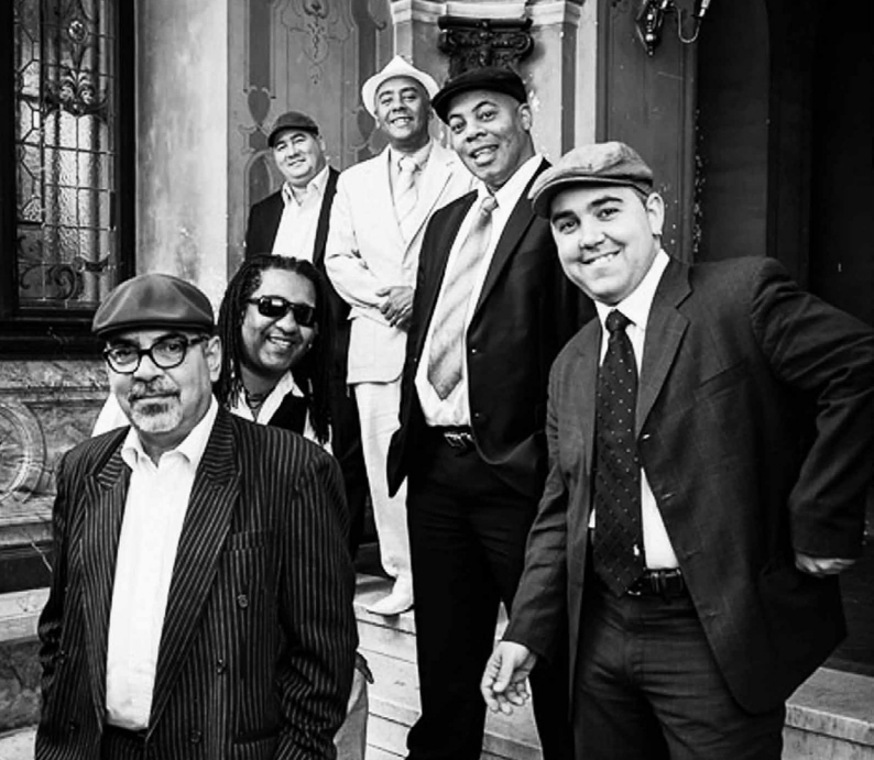
Conexion Cubana