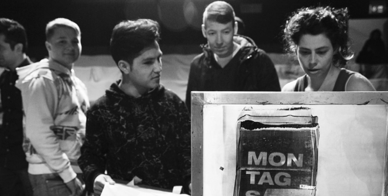
Siebdrucken mit #Rosenwerk im Montagscafé | Foto: Wanja Saatkamp