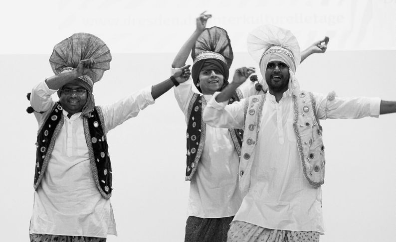
SANSKRITI Dresden zur Eröffnung der Interkulturellen Tage 2018