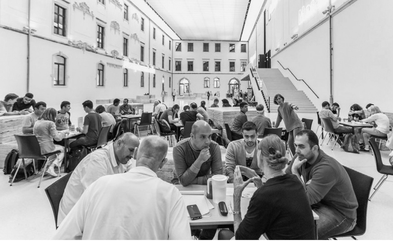
ABC-Tische im Lichthof des Albertinum