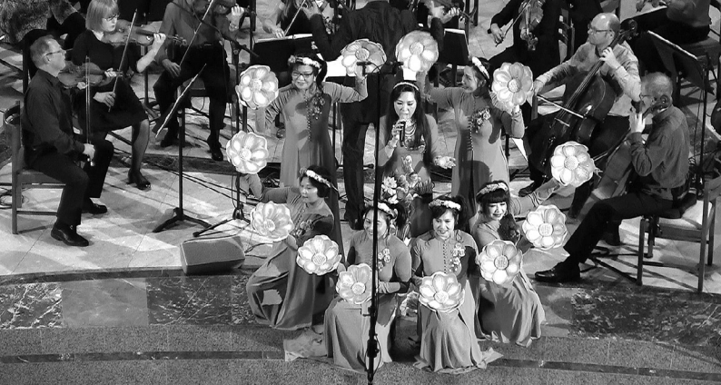
4. Interreligiöses Friedenskonzert: Zuerst Mensch – In Musik vereint