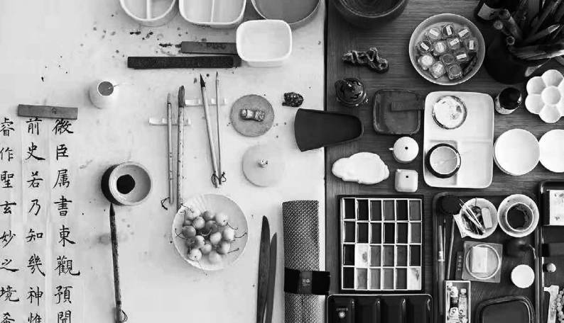
Shudao – Studio für chinesische Kultur