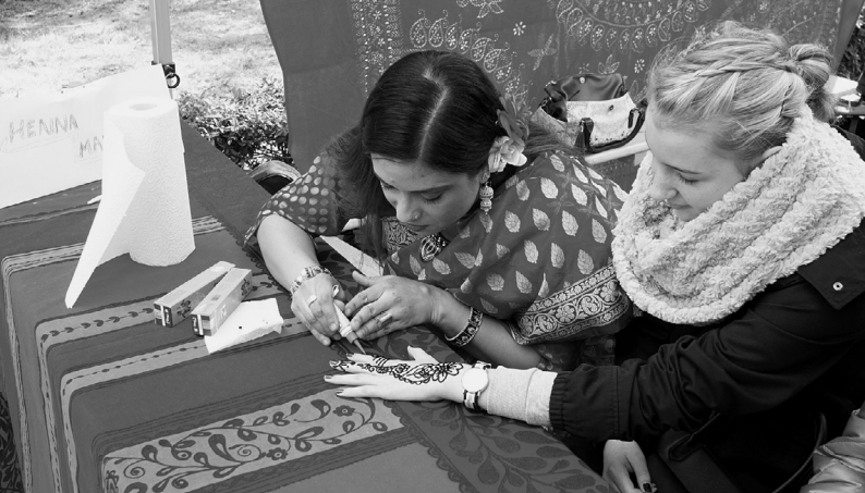
Interkulturelles Straßenfest 2018