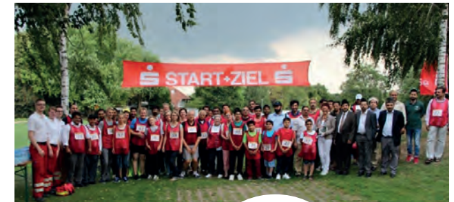
Foto: Charity Walk

Zur Teilnahme laden herzlich ein die Ahmadiyya-Gemeinde, die NABU KV Borken e.V. und der Bocholter Integrationsrat. www.ahmadiyya.de