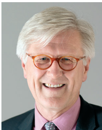
Reinhard Kardinal Marx Vorsitzender der Deutschen Bischofskonferenz